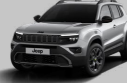
GRANİT GRİ* (METALİK)