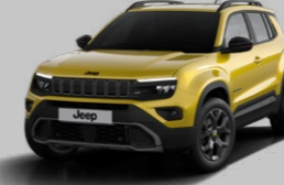
GÜNEŞ SARISI (METALİK)