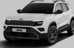
KAR BEYAZI* (PASTEL)