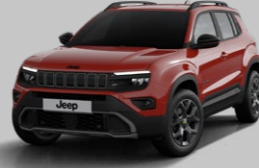
RUBY KIRMIZI* (PASTEL)