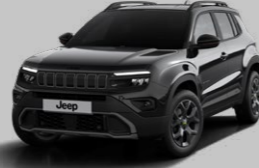
VOLCANO SİYAH (PASTEL)