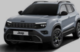
FIRTINA GRİ* (PASTEL)