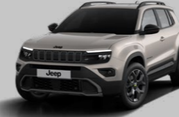
KUM BEJİ* (METALİK)